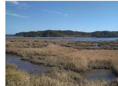
花咲線(別寒辺牛湿原)