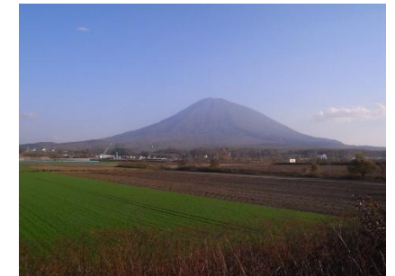
函館線(山線)(羊蹄山)