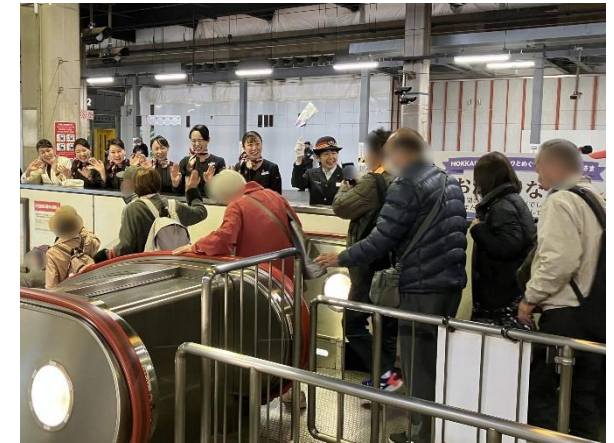
札幌駅でのお手振り(2025年度実施時)