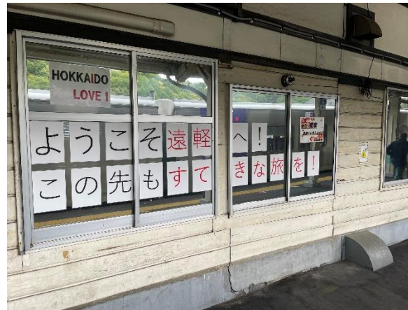
遠軽駅(2025年度実施時)