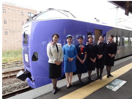
261系5000代 多目的特急車両「ラベンダー」編成と JALふるさとアンバサダー・JALふるさと応援隊(2025年度実施時)